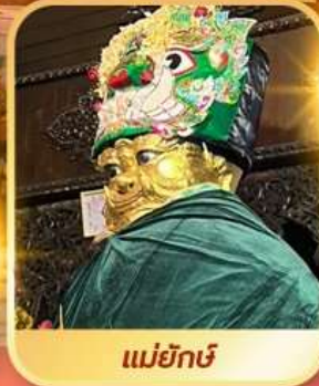
แม่ยักษ์