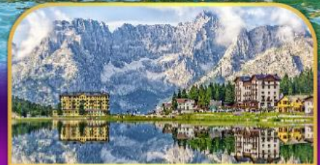
ทะเลสาบมีสุรีนา