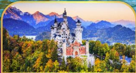
ปราสาทนอยชวานส์ไตน์