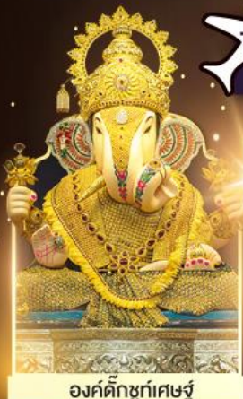
องค์ตั้งบูชท์พิเศษ