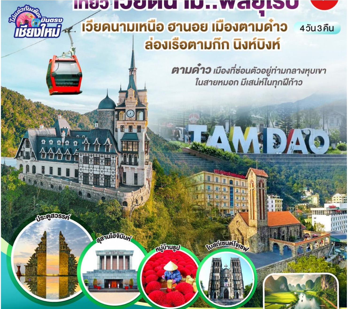
ประตูลี้สวรรค์

ตามด้าว เมืองที่ซ่อนตัวอยู่ท่ามกลางหุบเขา ในสายหมอก มีเสน่ห์ในทุกฝีก้าว