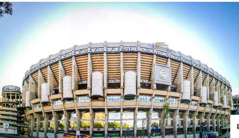
สนามฟุตบอล ซานเตียโก เบร์นาเบว (Estadio Santiago Bernabéu)

ชมด้านหน้า สนามฟุตบอล ซานเตียโก เบร์นาเบว (Estadio Santiago Bernabéu) คือสนามเหย้าของทีม รีล มาดริด (Real Madrid) หนึ่งในสโมสรฟุตบอลที่ยิ่งใหญ่และประสบความสำเร็จที่สุดในโลก ตั้งอยู่ในใจกลางกรุง มาดริด ประเทศสเปน