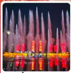
น้ำพุคังปาสือ