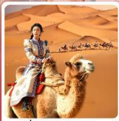
ขี่อูฐชมทะเลทราย

• ไฮไลท์ ชมความงามอุทยานหุบเขาคลิ้น มรดกโลกภูเขาสายรุ้ง ตามรอยวิถีชีวิต และพิภพระเืองของชาวมองโกเลีย