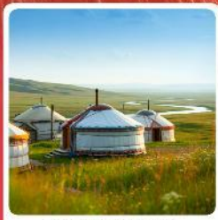
ทุ่งหญ้าออร์ดอส