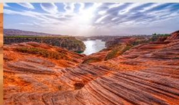
อุทยานหุบเขาคีลิน

*ทางบริษัทฯ ขอสงวนสิทธิ์ในการสลับโปรแกรมทัวร์ตามความเหมาะสมขึ้นอยู่กับสถานการณ์หน้างาน โดยคำนึงถึงผลประโยชน์ของลูกค้าเป็นสำคัญ