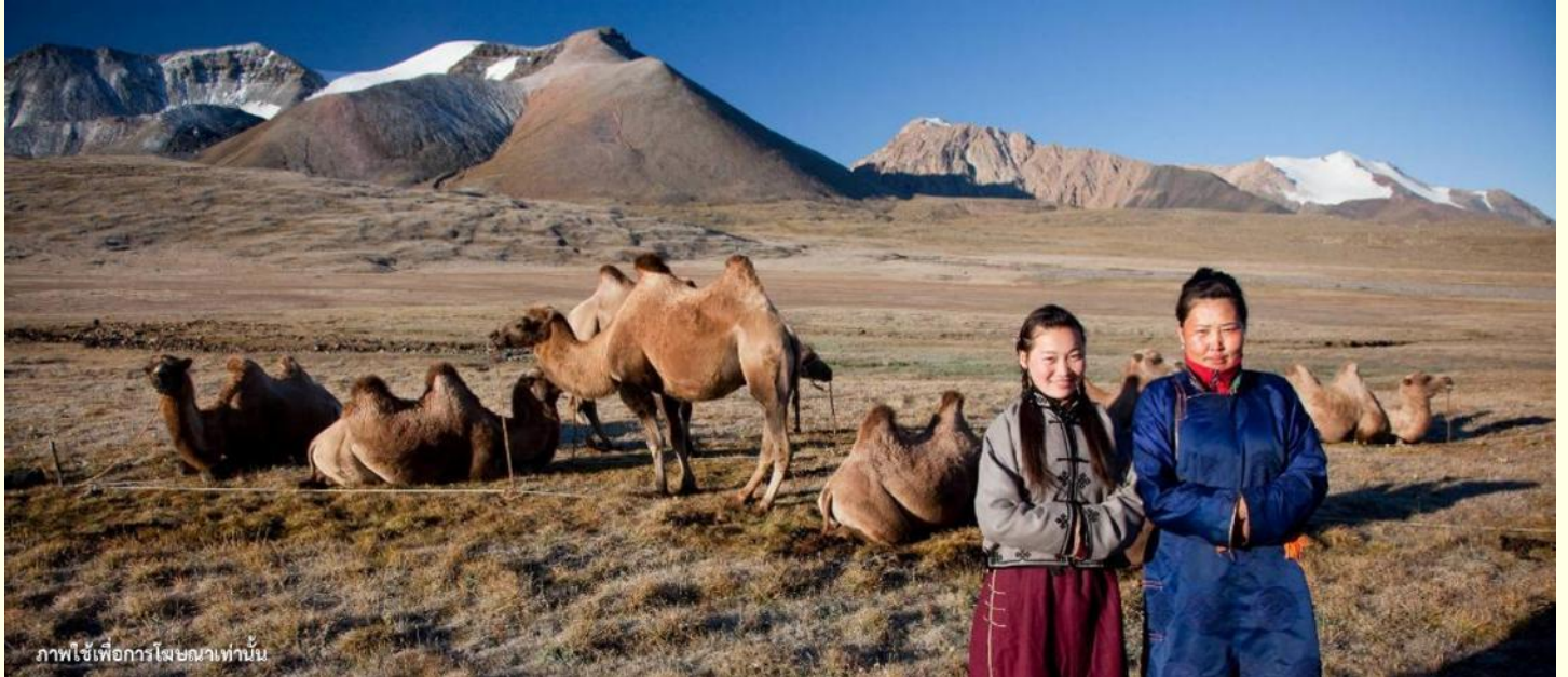
ภาพใช้เพื่อการโฆษณาเท่านั้น

นำท่านร่วมกิจกรรม พิธีต้อนรับแขกสไตล์มองโกล เป็นประเพณีโบราณที่มีมาช้านาน ชาวมองโกลมีอุปนิสัยที่รักเพื่อนฝูงและตรงไปตรงมาไม่เสแสร้ง เมื่อมีเพื่อนหรือแขกมาเยือนก็มักจะผูกมิตรอย่างจริงจัง และนำท่านร่วมกิจกรรม สวมใส่ชุดมองโกล สัมผัสพลังแห่งบรรพบุรุษ สวมเสื้อคลุมแบบดั้งเดิมที่มีสีสันสดใส ปักลวดลายอันประณีต คุณจะสัมผัสได้ถึงพลังแห่งบรรพบุรุษที่เคยปกครองดินแดนครึ่งโลก การสวมหมวกขนสัตว์ ผูกสายรัดเอว พร้อมเครื่องประดับเงินแท้ที่ส่องแสงระยิบระยับ จะทำให้ท่านเสมือนกลายเป็นนักรบแห่งทุ่งหญ้า พร้อมเครื่องประดับเงินแท้ที่ส่องแสงระยิบระยับ ของชนเผ่าที่เคยปกครองดินแดนครึ่งโลก เมื่อคุณยืนท่ามกลางทุ่งหญ้าไร้ขอบเขต