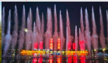
น้ำพุคังปาซื่อ