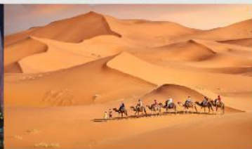
ทะเลทรายเสียงชวาน