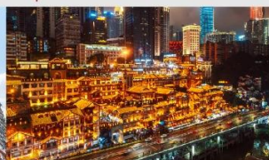
หงหยาดัง(ตอนกลางคืน)

*ทางบริษัทฯ ขอสงวนสิทธิ์ในการสลับโปรแกรมทัวร์ตามความเหมาะสมขึ้นอยู่กับสถานการณ์หน้างาน โดยคำนึงถึงผลประโยชน์ของลูกค้าเป็นสำคัญ