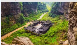
อุทยานหลุมฟ้าสะพานสวรรค์