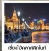
เซี่ยงไฮ้ คคลาสสิกไนท์