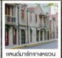
แลนด์มาร์กจางหยวน

เซี่ยงไฮ้ คคลาสสิก ไนท์ / 3 ดึกใหญ่แห่งเซี่ยงไฮ้ คองเรือหมู่บ้านโบราณจูเจียเจียว / EKA Tianwu / วัดหลงหัว แลนด์มาร์ก จางหยวน / ถนนหวยไห่ / ชมโชว์ ERA ที่โรงละครโด่งดังระดับโลก / ซินเทียนตี้