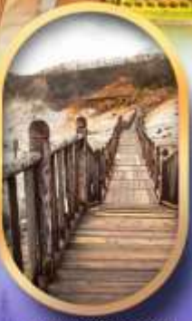
หุบเขาจิกุกดาบิ