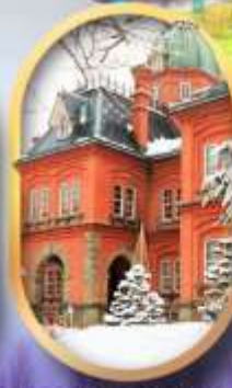
ศาลาว่าการฮอกไกโด