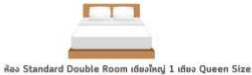
ห้อง Standard Double Room เตียงใหญ่ 1 เตียง Queen Size