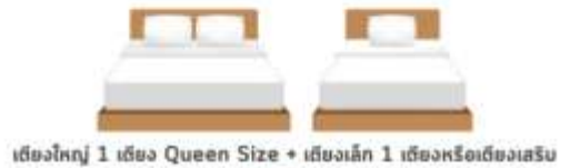
เตียงใหญ่ 1 เตียง Queen Size + เตียงเล็ก 1 เตียงหรือเตียงเสริม