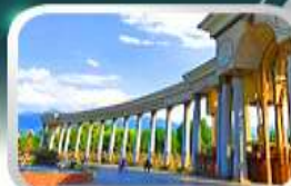
1st President Park