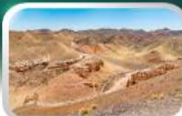
ชารินแกรนด์แคนยอน