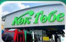
ซิ่นโทกโทเบซิมวออัลมาตี

นั่งกระเช้าซิมบูลัค-ทะเลสาบโคลไซ-โบสถ์เซมคอฟ