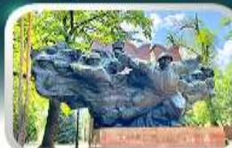
Panfilov Guardsmen Park