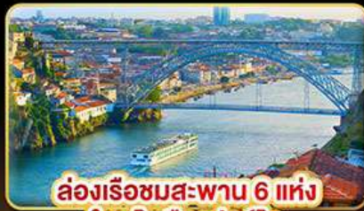
ล่องเรือชมสะพาน 6 แห่ง ในคูโรเมืองปอร์โต