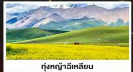
ทุ่งหญ้าจีเหลียน