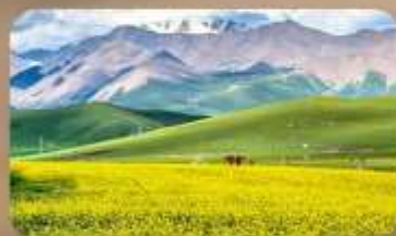
ทุ่งหญ้าซีเหลียน