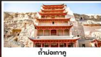
ถ้ำม่อเกาตุ