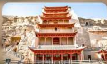
กำม่อเกาคู