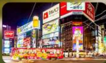
ซูปป์ิงย่านซูซุกิโนะ