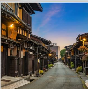
“TAKAYAMA OLD TOWN”