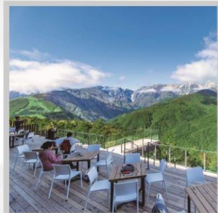
“HAKUBA MOUNTAIN HARBOR”

นำท่านไปโอบกอดธรรมชาติที่ครบครันในที่เดียว “คามิโคจิ” สวิสเซอร์แลนด์แดนญี่ปุ่นเทือกเขาที่ปกคลุมด้วยหิมะสวยงาม ชมความงามของ “ทุ่งพืชมอส ฟุจิชิบะซากุระ” มนต์เสน่ห์..พรมธรรมชาติสีชมพูหลากสีสดใส เปลี่ยนอริยาบท “จันทรະเข้าฮาคุบะ อิวะตะกะ” เพื่อชมวิวพาโนรามาของเทือกเขาแอลป์ญี่ปุ่นกันให้อิ่มใจ สัมผัสกลิ่นอายเมืองเก่า “เมืองทาคายามา” ที่ยังคงอนุรักษ์ความเป็นอยู่ เมื่อสมัยเอโดะกว่า 300 ปี สายช้อปปิ้งห้ามพลาด “คารุอิซาวะ เอ้าท์เล็ต” แลนด์มาร์กของเมืองคารุอิซาวะ และ “ย่านชินจูกุ” แห่งเมืองโตเกียว ชมความงามกับเส้นทาง “เจแปนแอลป์ (ท่าแพงหิมะ)” สุดยอดของการท่องเที่ยวที่ถูกขนานนามว่า “หลังคาแห่งญี่ปุ่น”