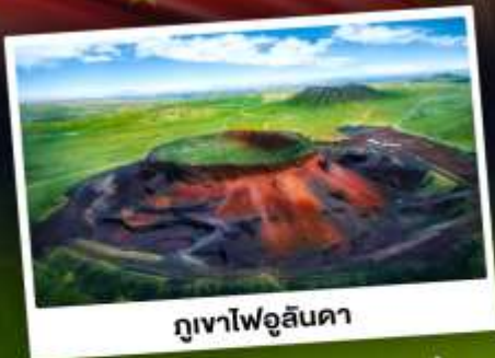
ภูเขาไฟอูลันดา

ท่องเที่ยวแดนแห่งทะเลทรายและทุ่งหญ้า ชมพระอาทิตย์ขึ้นทุ่งหญ้าออร์ดอส