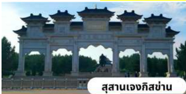
สุสานเจงกิสข่าน

นำท่านสู่ สุสานเจงกิสข่าน(ชมด้านนอก) สถานที่แห่งความศักดิ์สิทธิ์และเป็นที่เคารพสักการะของชาวมองโกล ปัจจุบันได้รับการบูรณะ ประกอบด้วยพระตำหนักหลักสามหลัง สร้างขึ้นในรูปแบบสถาปัตยกรรมมองโกล รูปร่างคล้ายกระโจมขนาดใหญ่ อาคารเชื่อมต่อกันด้วยระเบียงทางเดิน ภายในประดิษฐานพระบรมรูปของเจงกิสข่านสูง 5 เมตร ทรงเครื่องรบเต็มยศอย่างองอาจกล้าหาญสง่างาม ด้านหลังเป็นภาพแผนที่ "สี่อาณาจักรข่าน" อันได้แก่ อาณาจักรข่านซากาไต, อาณาจักรอิลข่าน, อาณาจักรโกลเดนฮอร์ด, และอาณาจักรหยวนของกุบไลข่าน พระตำหนักด้านหลังประดิษฐานหีบพระศพจำลองคลุมด้วยผ้าแพรสีเหลือง ซึ่งบรรจุสิ่งของส่วนพระองค์ (ไม่รวมค่าเข้าชมภายใน ราคาท่านละ 90 หยวน)