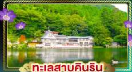
ทะเลสาบคินริน