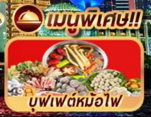
บุฟเฟ่ต์หม้อไฟ