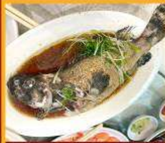
ปลาหนึ่งซีอิ้ว