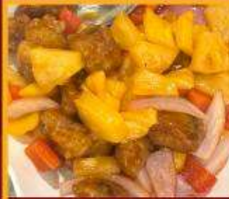
กระดุกหมูผัดเปรี้ยวหวาน