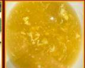
ซุ๊ปข้าวโพด