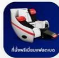
ที่นั่งพรีเมียมเฟลด์เบด