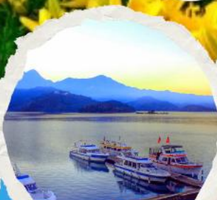
ทะเลสาบสุริยขึ้นจินทารา