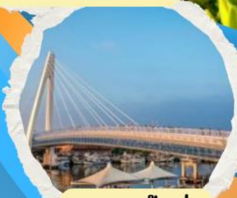
สะพานตงสู่ย