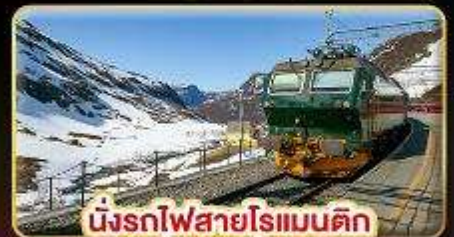
นั่งรถไฟสายโรแมนติก “พร้อมสปาานา”