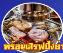
พร้อมเสิร์ฟปิ้งย่างเกาหลี