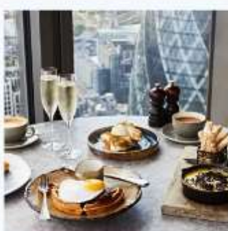
DUCK AND WAFFLE