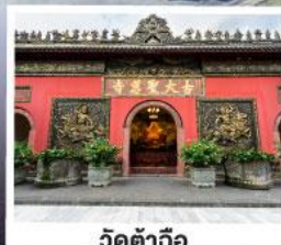
วัดตำฉือ