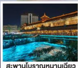
สะพานโบราณหนานเฉียว