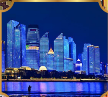
หาดโซเบอร์ฟังก์