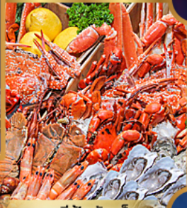
อาหารซีฟู้ดจัดเต็ม

บุฟเฟ่ต์เบียร์ไม่อั้น + ซีฟู้ด + บิงย่างเกาหลี