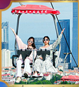
นั่งกระเช้า ชมเมือง