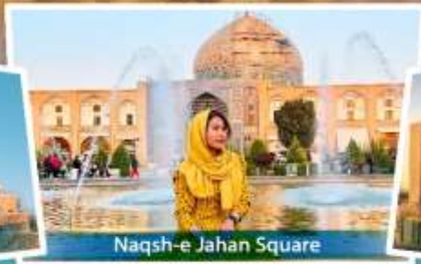
Naqsh-e Jahan Square