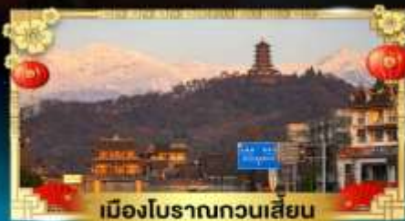
เมืองโบราณกวนเสียน