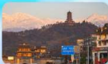
เมืองโบราณกวนเสี้ยน