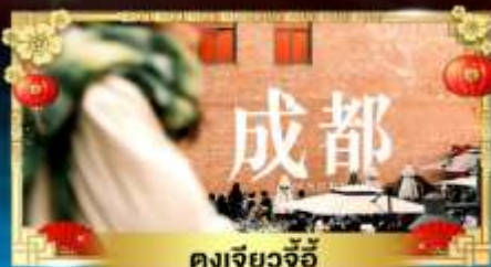
ตงเจียวจี้

เทือกเขาแอลป์แห่งเมืองจีน ชมความงามของ "อุทยานภูเขาสี่ครุณี"