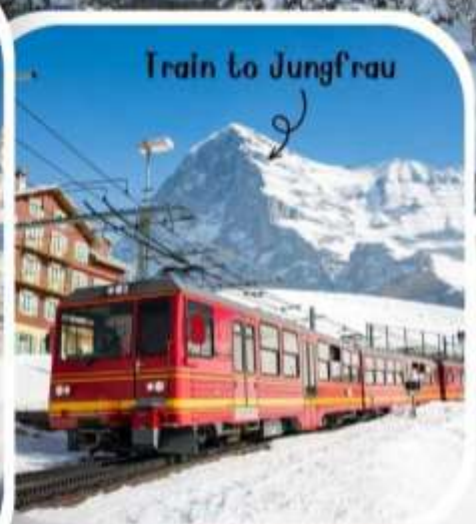
Train to Jungfrau