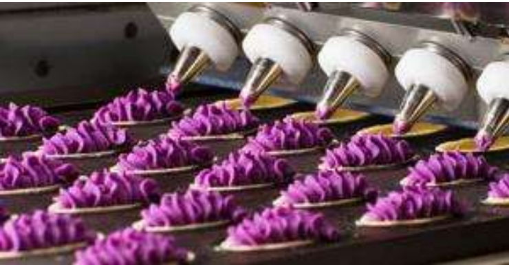
Okashigoten Confectionary Factory Line